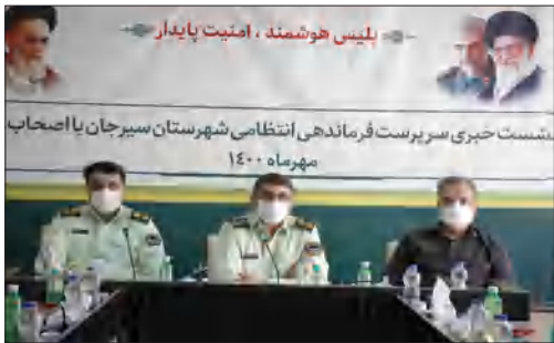
از ۶ هزار مورد درخواست و صدور، پروانه کسب ۱۳ هزار مورد و بیش از ۸ هزار مورد عدم سوء پیشینه انجام شده است.

سرهنگ رمضان نژاد به جرایم در فضای مجازی پرداخت و گفت: اقدامات خوبی همکاران ما در پلیس فتا انجام داده اند و با توجه به این که بیش تر جرایم به سمت فضای مجازی می رود، ۹۴ درصد پرونده ها را در زمینه های کلاهبرداری، اخلاقی و... به سرانجام رساندند.