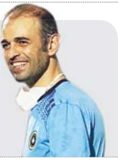
در صفحه ۵ بخوانید

سرمری سپاهان اصفهان گفت: همانگونه که سازمان لیگ برای برگزاری مسابقه ما در سواحه همه توان خود را به کار گرفت و جدیت به خرج داد، انتظار است که بدون ملاحظه و مامشات با سایر تیم‌ها، رقابت‌های لیگ برتر را نیز طبق برنامه و زمانبندی برگزار کند.