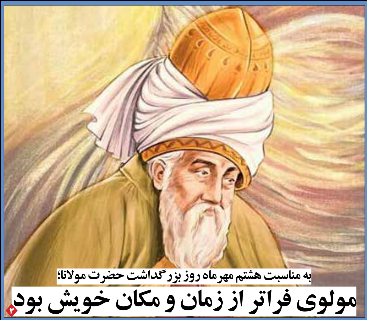
به مناسبت هشتم مهرماه روز بزرگداشت حضرت مولانا؛